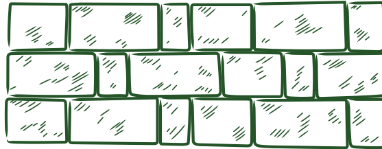
Exemple de calepinage